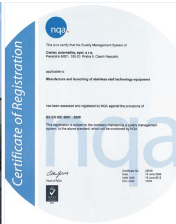
Die Centec Anlagenproduktion ist zertifiziert nach ISO 9001. The Centec Plant Production ist certified according ISO 9001.